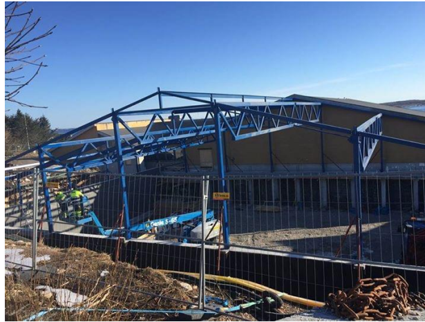
Her ser vi takkonstruksjonene på den nye basishallen på Frøya.