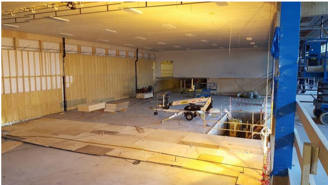
Hall under bygging i Tønsberg.

Her er noen bilder fra i vinter som viser haller under bygging.