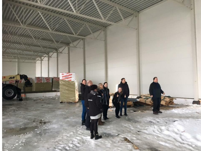
Basishallen i Kabelvåg har kommet under tak!