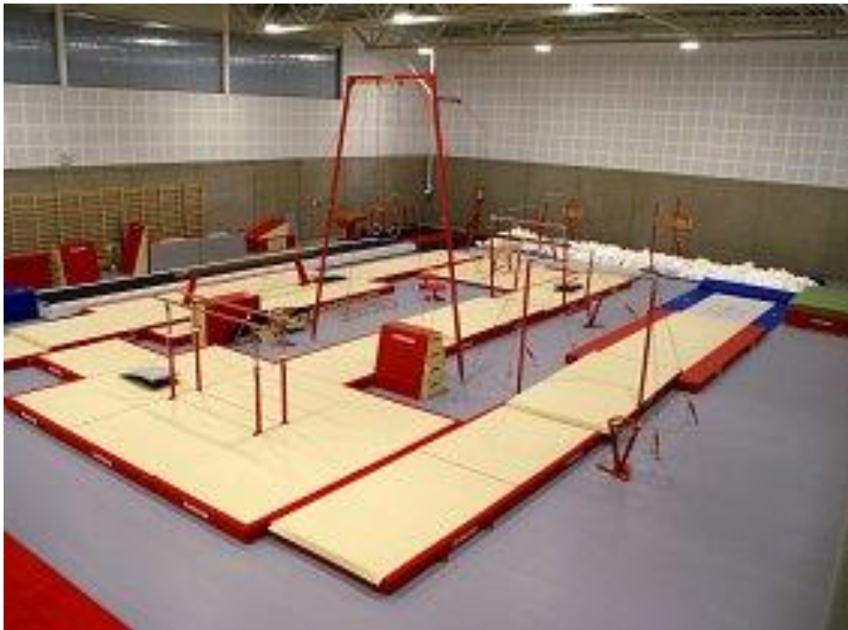
Oversiktsbilde av hallflaten i Leirskallen Turnhall

Leirskallen turnhall ble åpnet i desember 2015 av en entusiastisk ordfører i Oslo.