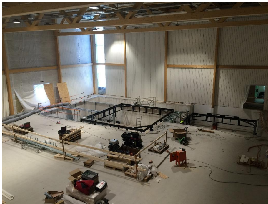
Gropene i basishallen på Harestua begynner å ta form!