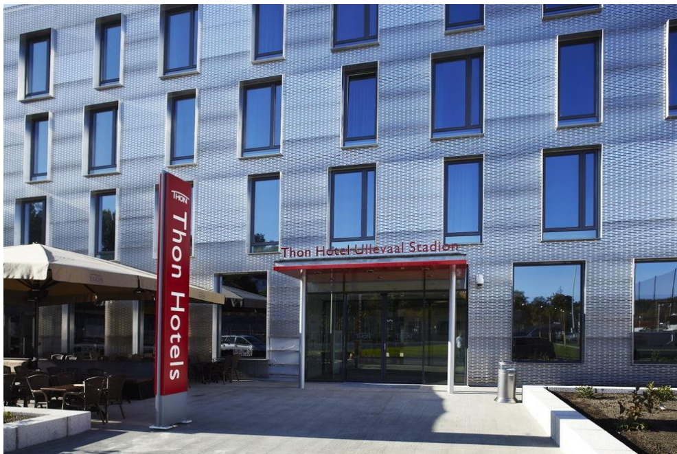
Utstyr- og anleggskonferansen 2016 finner sted 4.-5. november på Thon Hotel Ullevaal Stadion og UBC.

Norges Gymnastikk- og Turnforbund sin årlige utstyr- og anleggskonferanse arrangeres 4.-5. november på Thon Hotel Ullevaal Stadion i Oslo. Dette er en viktig møteplass for alle som er opptatt av gode utstyrmiljøer og basishaller. Det blir et bredt sammensatt program med viktige temaer. Blant annet vil lag som nylig har vært igjennom en byggeprosess presentere «sin historie». De viktigste utstyrsleverandørene vil være til stede under konferansen og det vil også bli avsatt tid til befaring til nye haller i Oslo-området. Nærmere informasjon om programmet samt påmeldingsskjema kommer før sommeren på www.gymogturn.no Sett av datoene i kalenderen allerede nå!