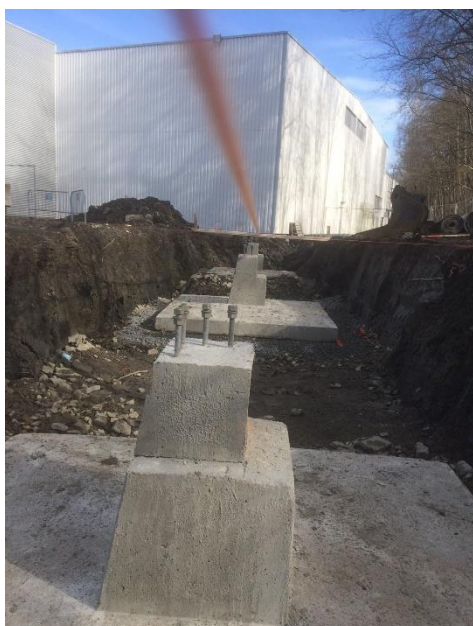
Fundamentene til den nye hallen til Oslo TF.