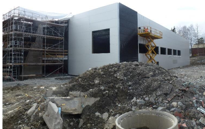
Status for basishallen på Lørenskog i midten av april!